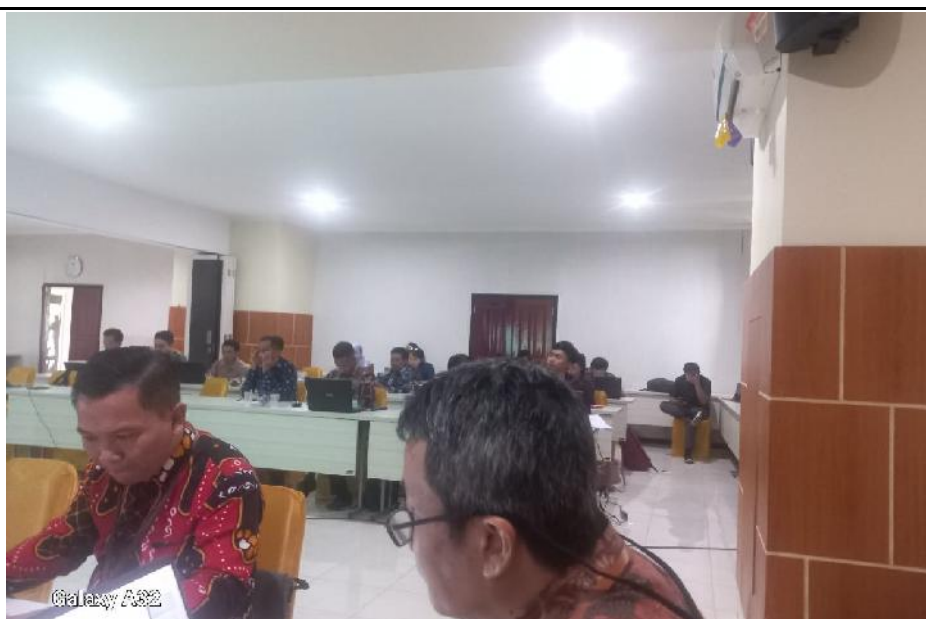
Kegiatan Penyusunan Rancangan Peraturan Menteri tentang Layanan Informasi Publik (Tgl. 16 Oktober 2023)