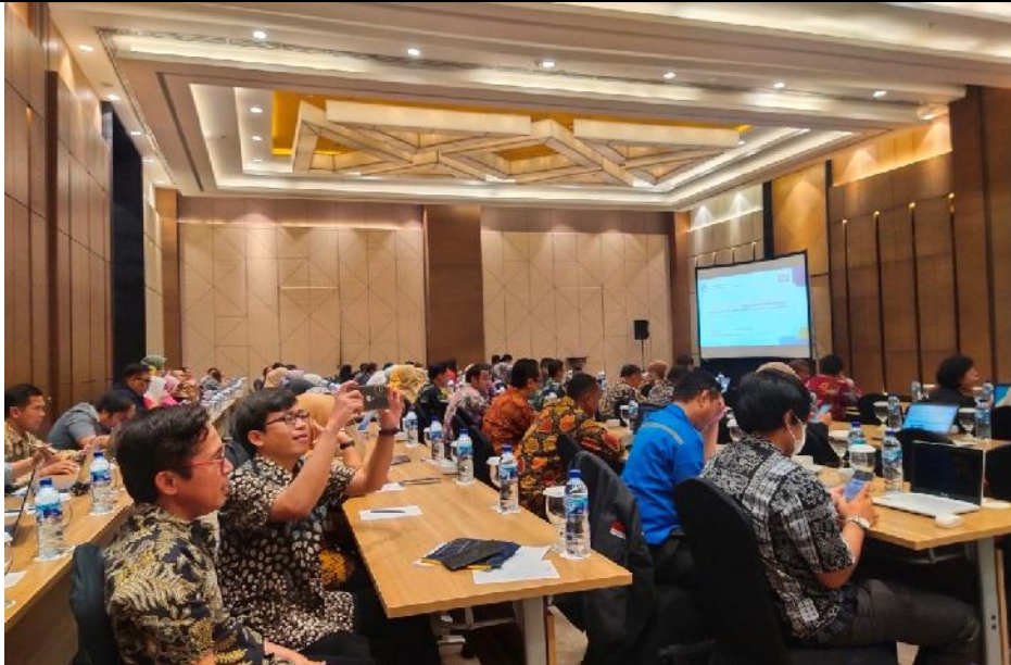
Kegiatan Rapat Penilaian Mandiri KIP Kemendikbudristek (Tgl. 8 September 2023)