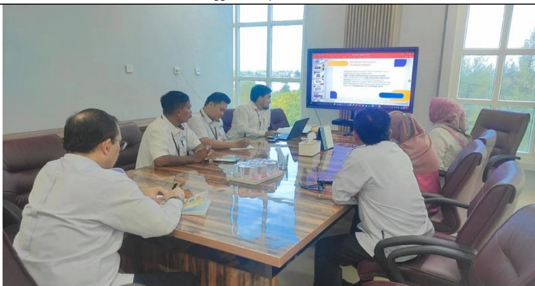
Lanjutan pembahasan Struktural pada SK Tim PPID LLDikti Wil. XIII (Tanggal 19 September 2023)