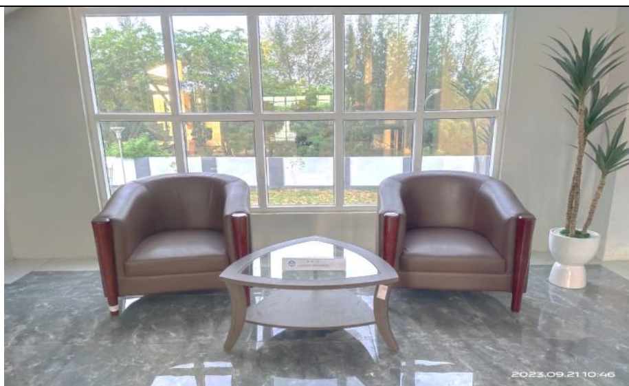
Penyiapan Meja & Kursi untuk Pelayanan Informasi PPID LLDikti Wilayah XIII (Tanggal 19 September 2023)