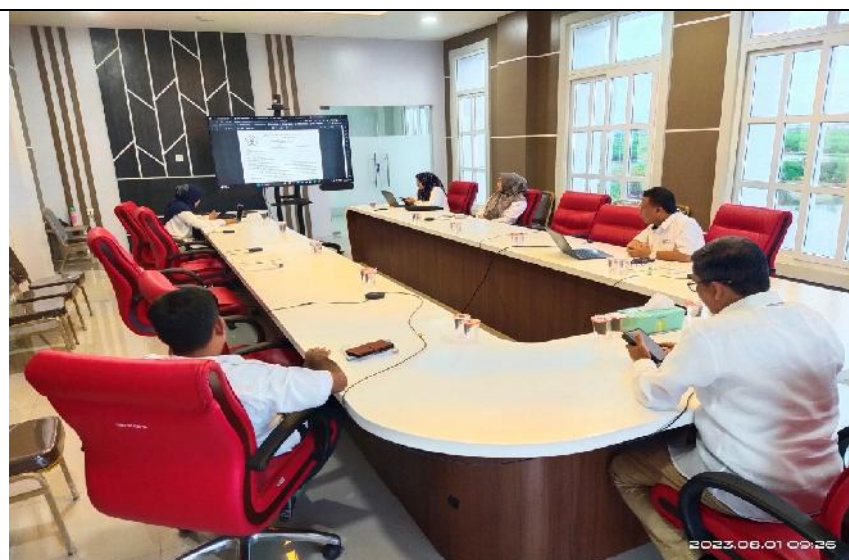
Pemparan surat permohonan informasi terkait KIPK Tahun 2021 (Tanggal 1 Agustus 2023)