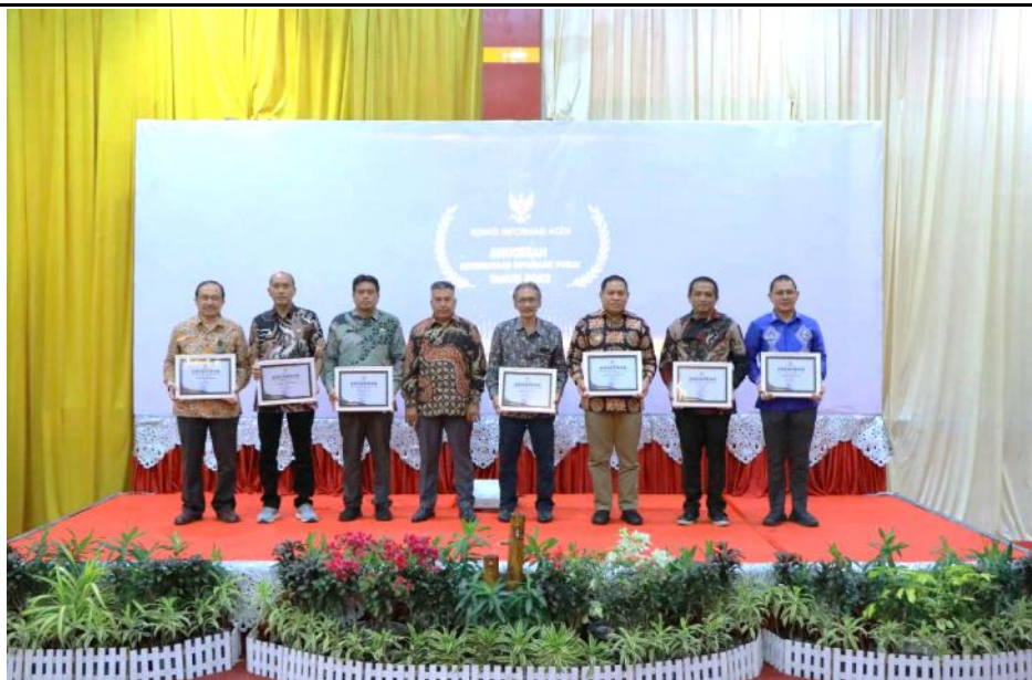
Para Penerima Anugerah KIA untuk kategori instansi vertikal (Tgl. 6 Desember 2023)