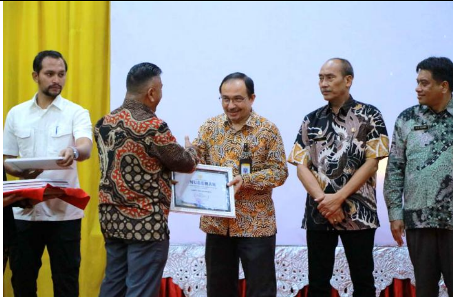
Penyerahan Anugerah KIA dengan nilai "Menuju Informatif" (Tgl. 6 Desember 2023)