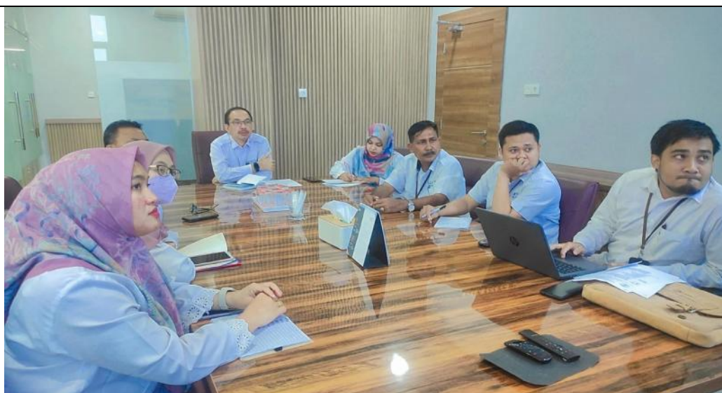
Tim PPID LLDikti Wil. XIII Rapat bersama Atasan PPID terkait Sosialisasi Penilaian Mandiri Tahun 2023 (Tanggal 19 September 2023)