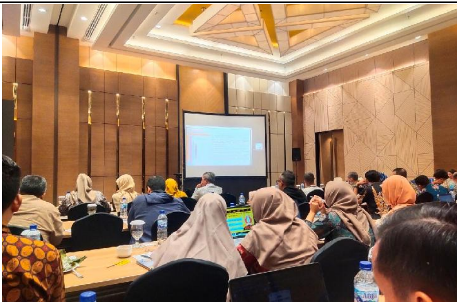
Suasana Kegiatan Rapat Penilaian Mandiri KIP Kemendikbudristek (Tgl. 8 September 2023)