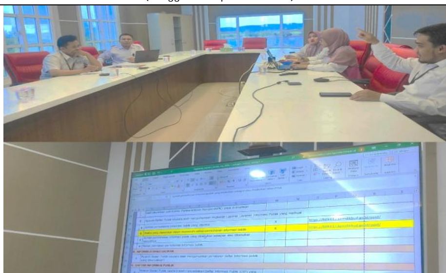
Pengisian Kuesioner KIP Aceh terkait Pelayanan Informasi PPID LLDikti Wilayah XIII (Tanggal 19 September 2023)