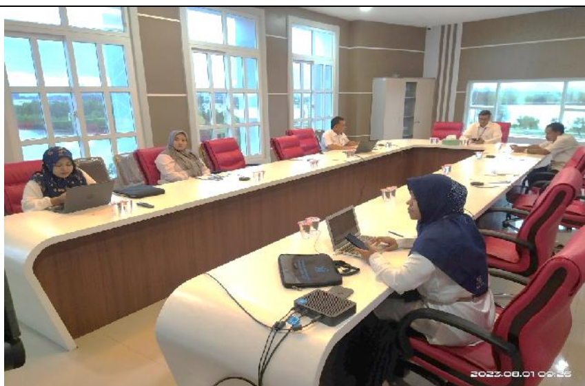
Rapat semester pertama Tim PPID LLDikti Wil. XIII (Tanggal 1 Agustus 2023)